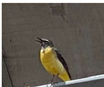
毎年春施設内に営巣するキセキレイ